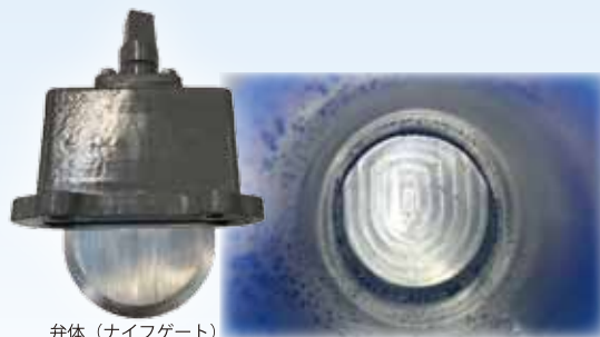
弁体(ナイフゲート)